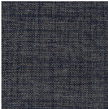
096 BLUE-BASALT CHAMELEON CK4145