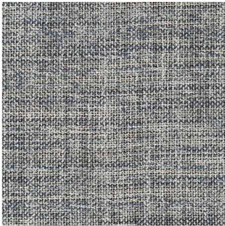
051 GRANIT CHAMELEON CK4145