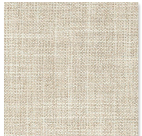
071 DESSERT CHAMELEON CK4145