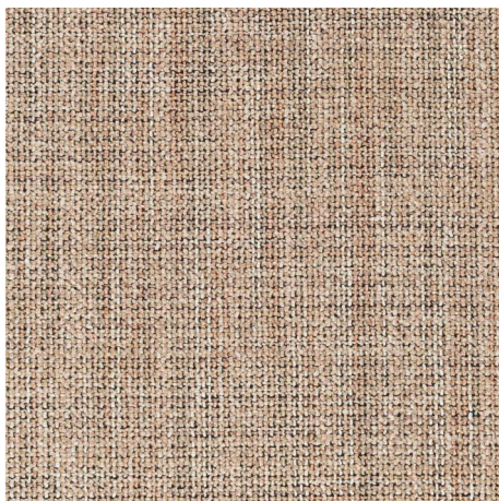
060 TUNDRA CHAMELEON CK4145