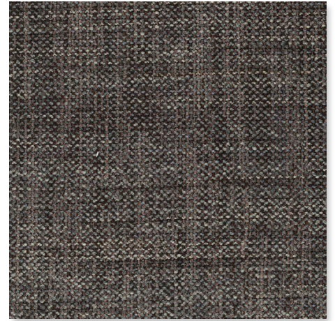
022 TAIGA CHAMELEON CK4145