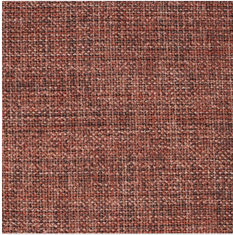
010 SANDALWOOD CHAMELEON CK4145