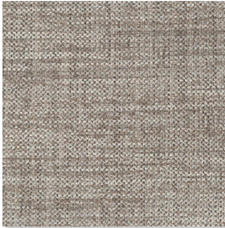
092 STEPPE CHAMELEON CK4145