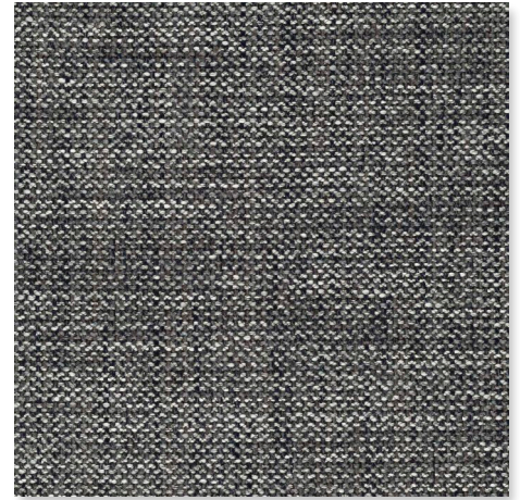
094 CAMOUFLAGE CHAMELEON CK4145