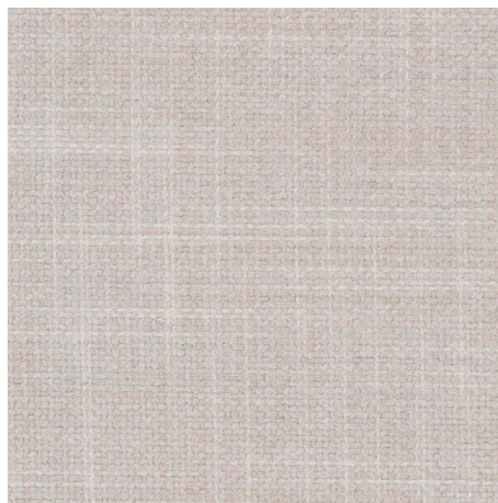
070 BEACH CHAMELEON CK4145