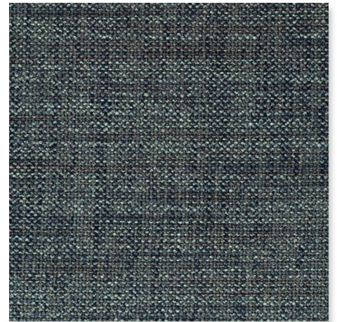
053 PIGEON CHAMELEON CK4145