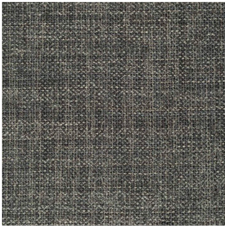
095 TARN CHAMELEON CK4145