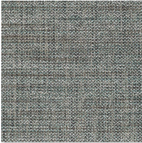
085 SALVIA CHAMELEON CK4145